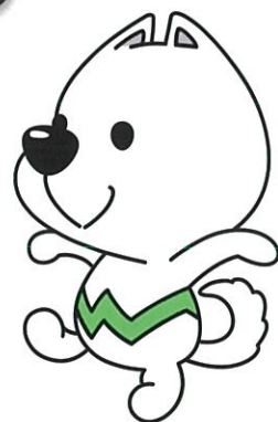
和歌山県PRキャラクター 「きいちちゃん」

主催 和歌山県産品建設資材登録事業者連絡会 【連絡先】 TEL 0736-64-8099