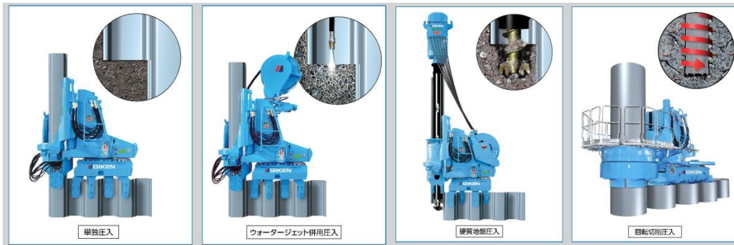
地盤条件による貫入技術