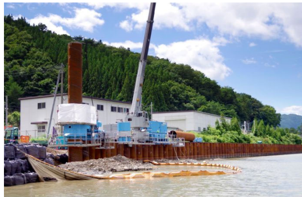
災害復旧や防災・減災工事の施工例